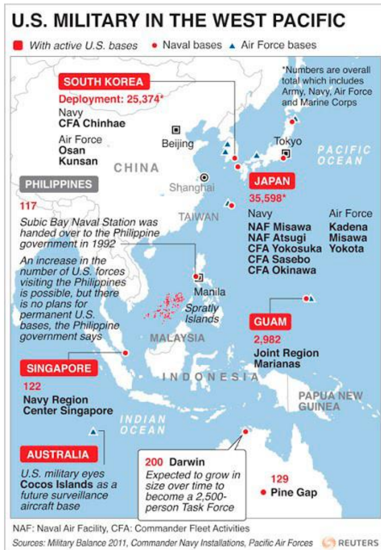
Infografía del despliegue militar de los EE.UU. 8